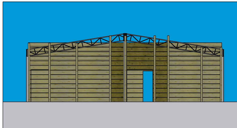
TÁBUAS FECHAMENTO FRENTE