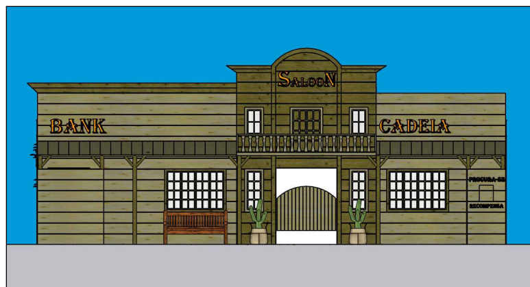
FACHADA COM VARANDA E DECOR