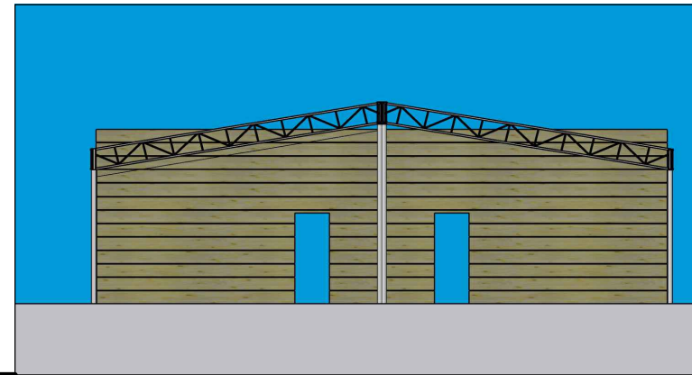
TÁBUAS FECHAMENTO FUNDO