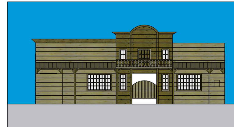
FACHADA COM VARANDA